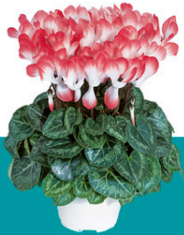
INDIAKA® Lachs - 53030 -