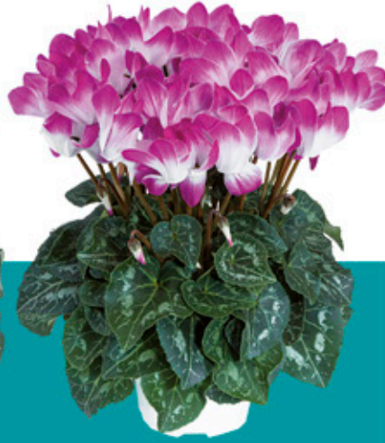
INDIAKA® Violett - 53090 -