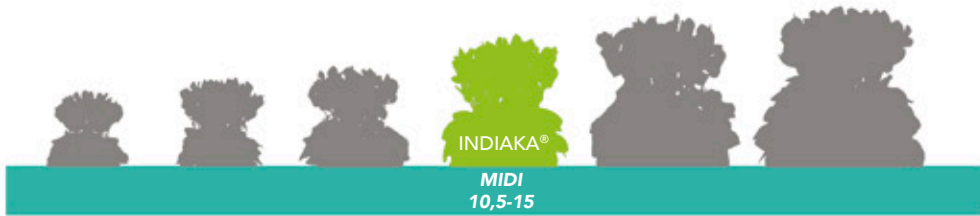
INDIAKA® MIDI 10,5-15