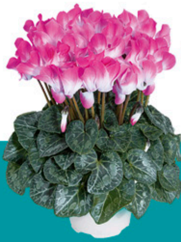
INDIAKA® Fuchsia - 53070 -