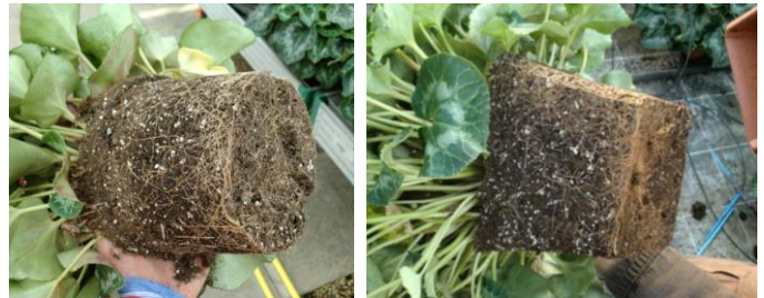
Bon système racinaire en flux / reflux

Objectif : développer et structurer la végétation de façon compacte (dense, dure, stable) et ronde jusqu'à atteindre la dimension complète voulue (homogène par rapport à la taille du pot).