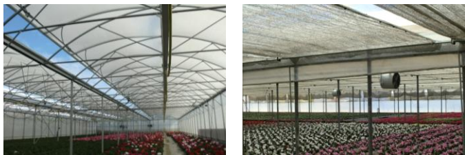
Ventilation zénithale et latérale, combinée à l'utilisation de ventilateurs supplémentaires pour créer le plus de mouvement d'air possible

Limiter les apports en eau aux stricts besoins de la plante est également un moyen de lutte contre une humidité excessive.