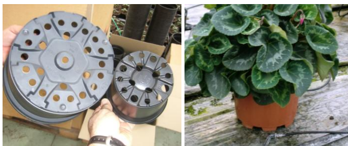
Design de fond de pot idéal en flux & reflux Pot surélevé, évitant la réabsorption de l'eau

Quant au plastique lui doit être opaque pour protéger les racines de la lumière. En subirrigation , le design du fond du pot est essentiel afin d'améliorer le drainage. En goutte à goutte , de petites rehausses sont nécessaires, notamment pour les cultures sur des surfaces irrégulières. Ainsi l'eau stagnant sous les pots ne sera pas réabsorbée.