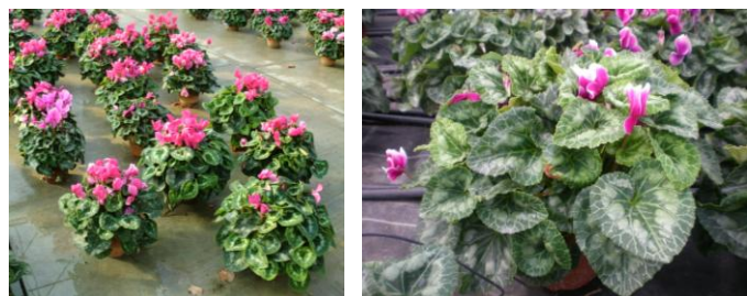
Feuillage étouffant la floraison

La période préalable à la floraison est la plus délicate et la plus critique. En cas de période de chaleur prolongée, de végétation importante avec une transpiration très prononcée et une demande d'eau non contrôlée, un étage de feuille supplémentaire peut se développer et la montée à fleur abondante peut être fortement retardée.