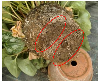
Pertes de racines

La perte de capillaires est souvent due à une asphyxie ou un stress hydrique, conséquence d'un apport en eau trop important ou encore un apport insuffisant. Afin d'éviter cette demande en eau excessive, il est conseillé de régler l'ombrage et les doses d'azote en fonction des moyennes de température (voir le tableau « Arrosage et engrais »).