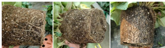
Zone racinaire en goutte à goutte

A = zone de racines actives – B = zone de transition avec EC élevée C = zone sèche sans racine