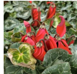
Brûlure des feuilles et des fleurs